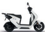
Pearl Sunbeam White