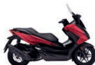
Új szín 2024 Pearl Siena Red