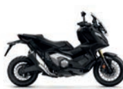
Matt Balistic Black Metallic