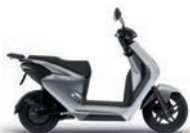
Digital Silver Metallic