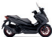
Matt Cynos Grey Metallic Special Edition