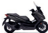
Matt Cynos Grey Metallic