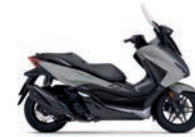
Pearl Falcon Grey