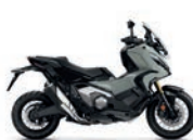
Új szín 2024 Pucó Blue