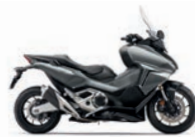
Új szín 2024 Iridium Grey Metallic