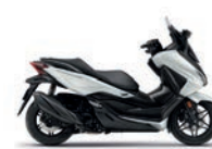
Új szín 2024 Matt Pearl Cool White