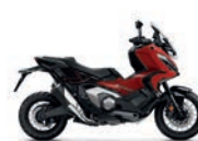
Új szín 2024 Grand Prix Red