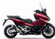
Új szín 2024 Candy Chromosphere Red