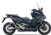
Matt Jeans Blue Metallic