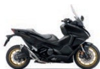
Új szín 2024 Matt Ballistic Black Metallic