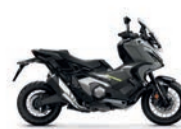
Új szín 2024 Iridium Grey Metallic