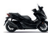
Új szín 2024 Pearl Nightstar Black