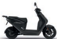
Matt Ballistic Black Metallic