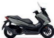
Pearl Falcon Grey