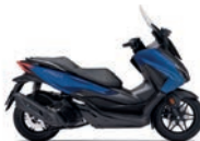
Matt Pearl Pacific Blue